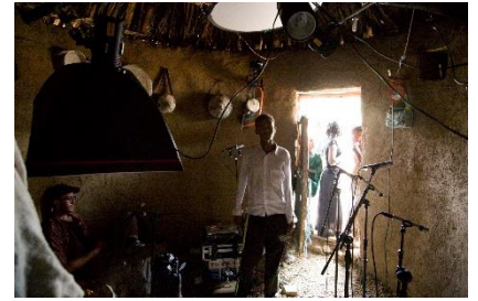
『ロアリング・アビス エチオピア初源のサウンド』

作品情報：人類の起源の地であり、あらゆる音楽が始まった地でもあるとともに新たな融合を生み出すエチオピアの音楽世界を、2年をかけフィールドレコーディングした貴重なロード・ムービー。