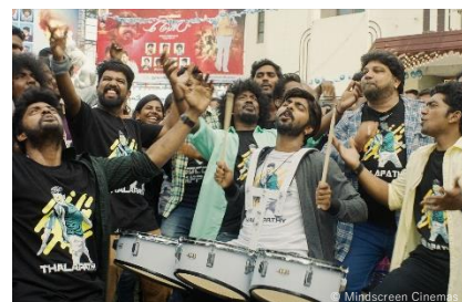
『響け！情熱のムリダンガム』

作品情報：映画オタクの青年が、ある日伝統楽器ムリダンガムの魅力に目覚め、一流のプレイヤーを目指す。迫力の音楽バトル、インド映画おなじみのダンスシーンなど、映画のあらゆる魅力をてんこ盛りにした激アツ作品！イメージフォーラム他、10月1日より全国公開予定の本作を先行特別上映。