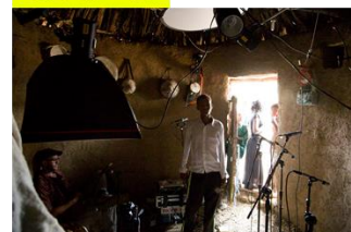
『ロアリング・アビス エチオピア初源のサウンド』