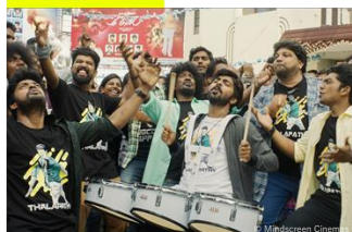
『響け！情熱のムリダンガム』