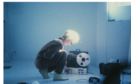
『シスターズ・ウィズ・トランジスターズ』

作品情報：彼女たちは電子機器に魅了され、音楽の伝統的な限界を乗り越えてきた。エレクトロニック・ミュージックにおける偉大な女性のパイオニアたち…。音楽史を読み直す刺激的なドキュメンタリーとして高評価を得た話題作。