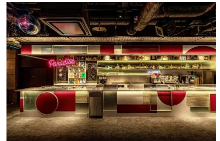
46F Paradise Lounge

Paradise Lounge はFPM 田中知之がセレクトした音楽と共に、渋谷の眺望が楽しめるミュージック・バー。音楽と夜景とドリンクとフードを楽しみながら、上映後のひと時をお過ごしください。