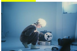
『シスターズ・ウィズ・トランジスターズ』